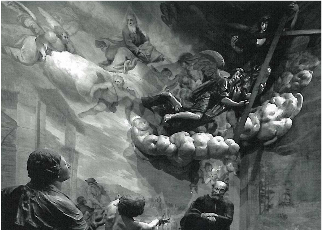
Sacro Monte Calvario di Domodossola - 1656