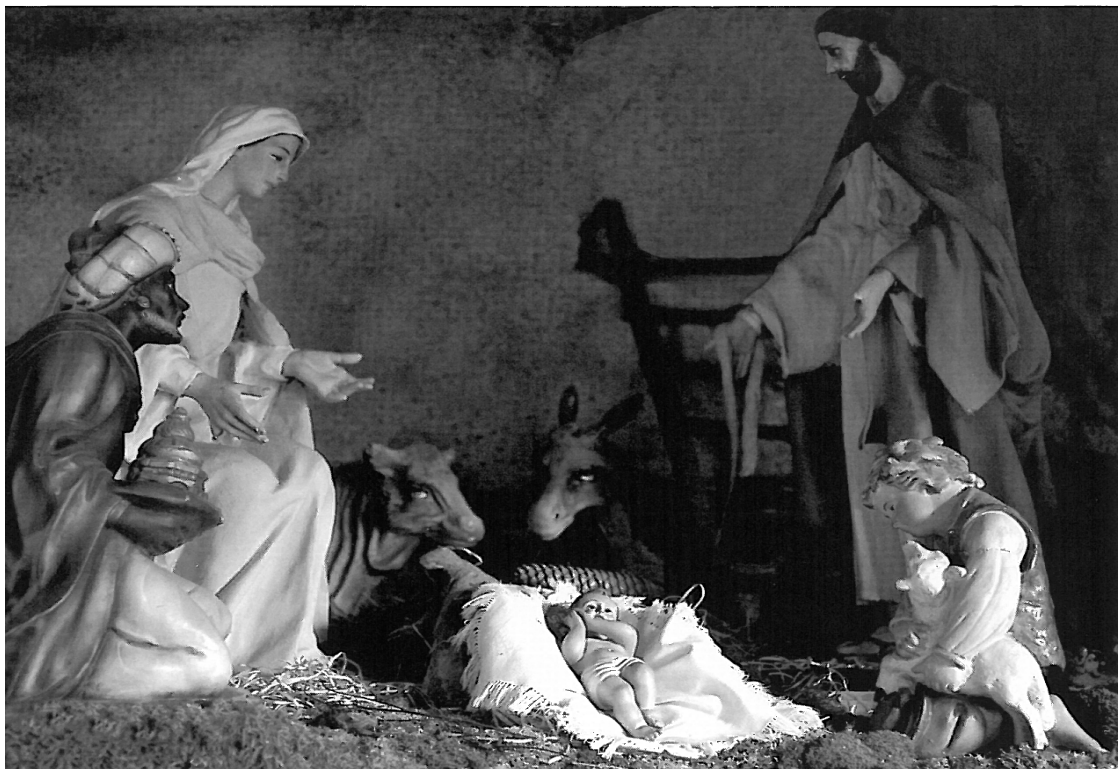
Sacro Monte di Belmonte - inizio del 18° secolo