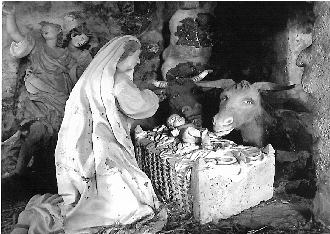
Sacro Monte della Beata Vergine di Oropa - 1617