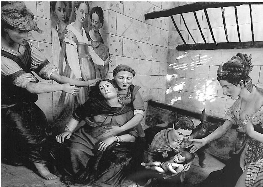
Sacro Monte di San Francesco di Orta San Giulio - 1590