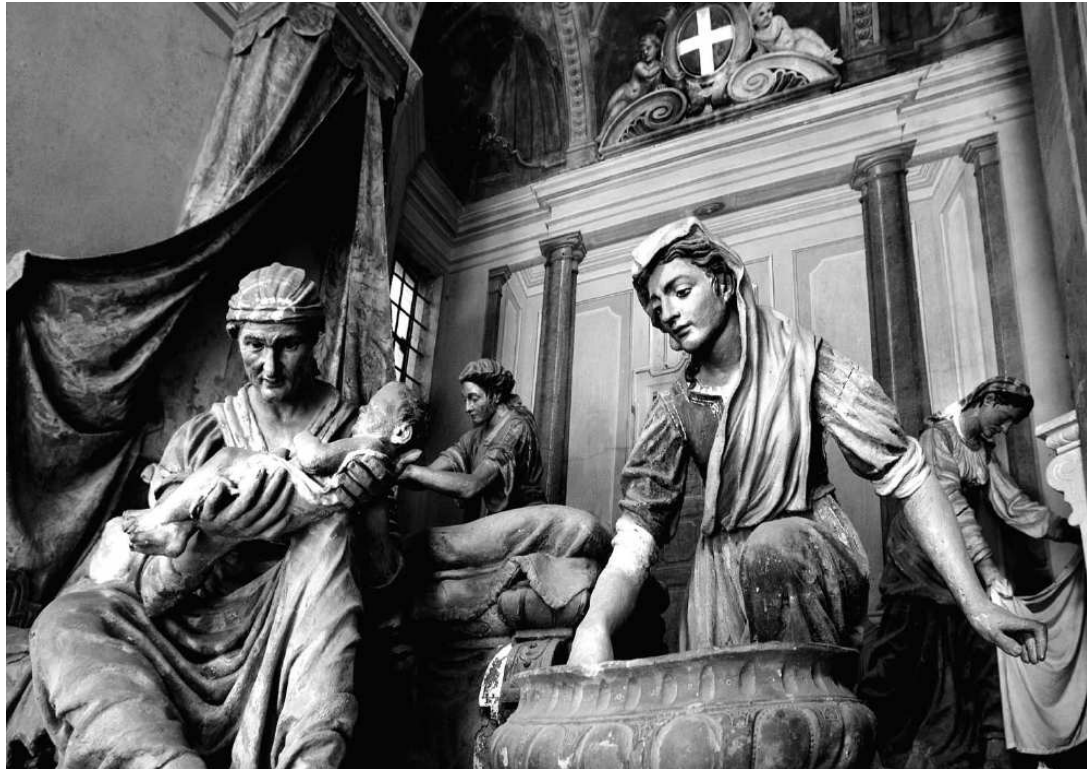
Sacro Monte di Santa Maria Assunta di Serralunga di Crea - 1589