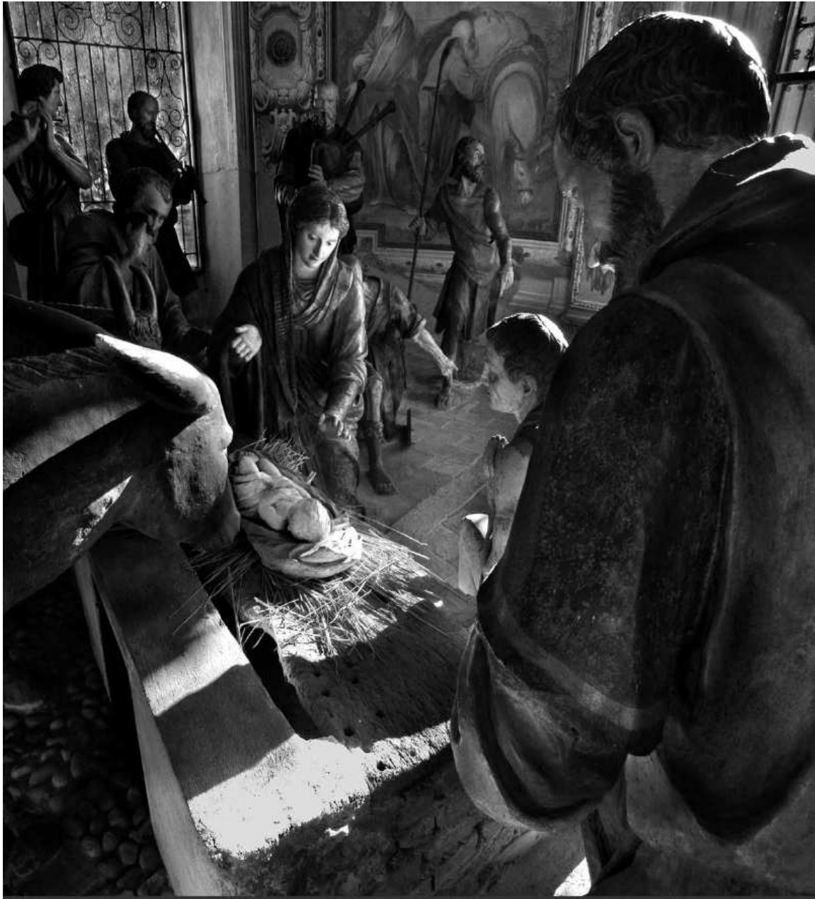
Sacro Monte del Rosario di Varese - 1610