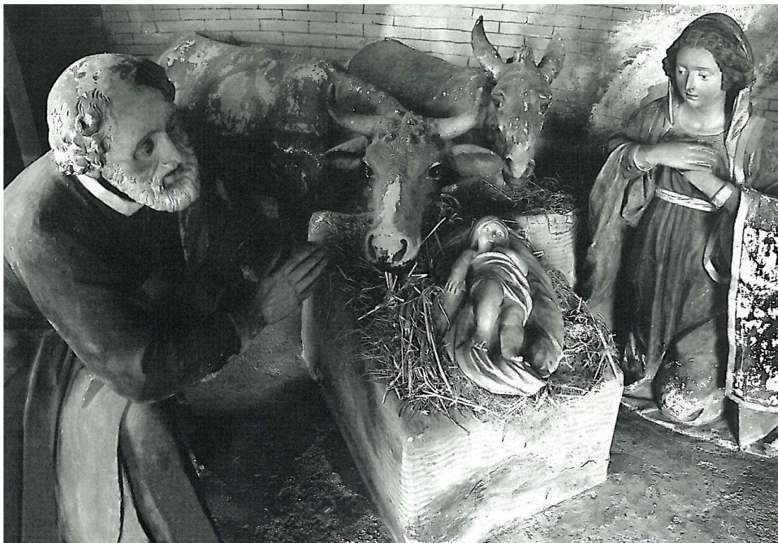
Sacro Monte della Beata Vergine del Soccorso di Ossuccio - 1635